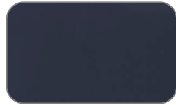
AAP Mysterious Blue