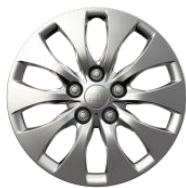
M: 16" stalowe obręcze kół z oponami w rozmiarze 205/55 R16