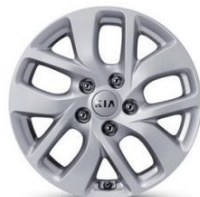
L: 16" aluminiowe obrzęcze kół z oponami w rozmiarze 205/55 R16