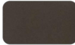
K7N Galaxy Brown