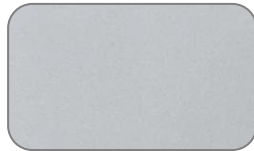
3D Bright Silver