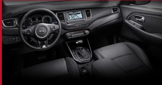
1 - tonowa czarna (WK)