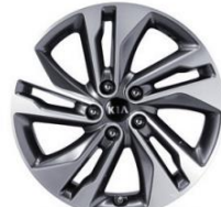
XL: 18" aluminiowe obrzęcze kół z oponami w rozmiarze 225/45 R18