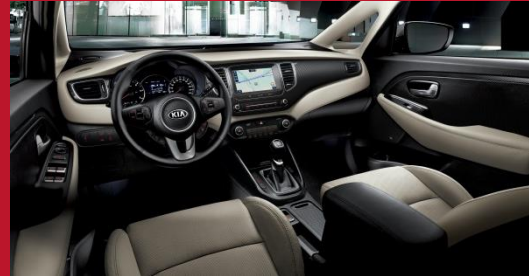
2- tonowa czarno – beżowa (DCM)